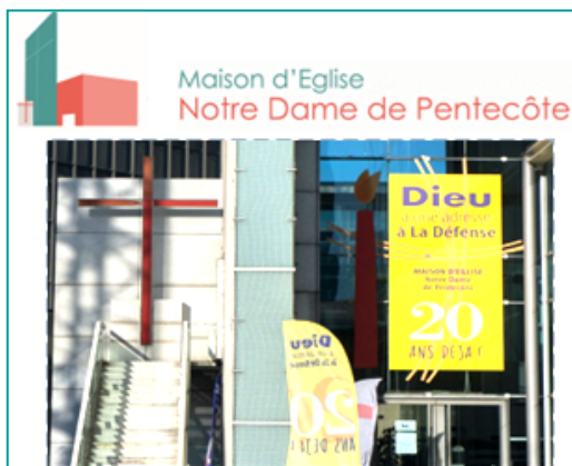
"Dieu a une adresse à La Défense"