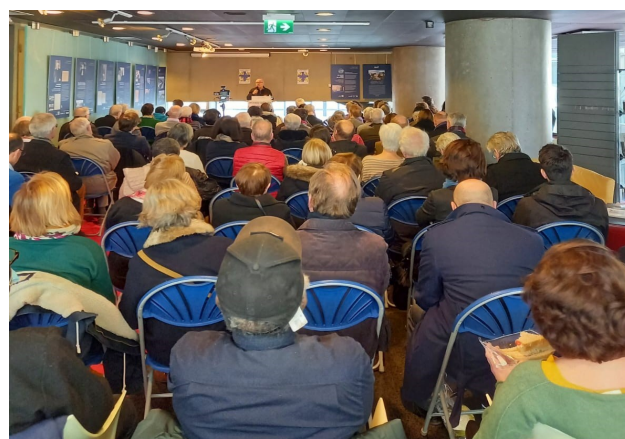
Photo de la 4ème conférence de carême du jeudi 16 mars à Notre Dame de Pentecôte