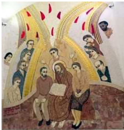
Mosaïque de Marko Rupnik

Seigneur notre Père, par la puissance de l'Esprit Saint, ouvre nos yeux pour savoir reconnaître ce qui est bon et beau dans le monde et dans nos frères et pour poser à notre tour et en retour, le regard d'amour que tu ne cesses de porter sur nous, tes enfants. Amen.